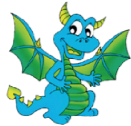
Donelson Hills Elementary